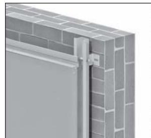
SZ Sistema macho-hembra