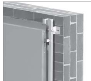
CH Sistema de cuelgue